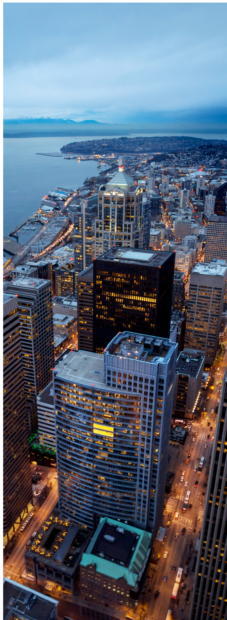
Utsikten från Columbia Tower där Ana och Christian, huvudpersonerna i boken, besöker en privat klubb.

När hon skrev ett inlägg om "50 orsaker till att jag aldrig kommer att läsa Femtio nyanser av honom" fick