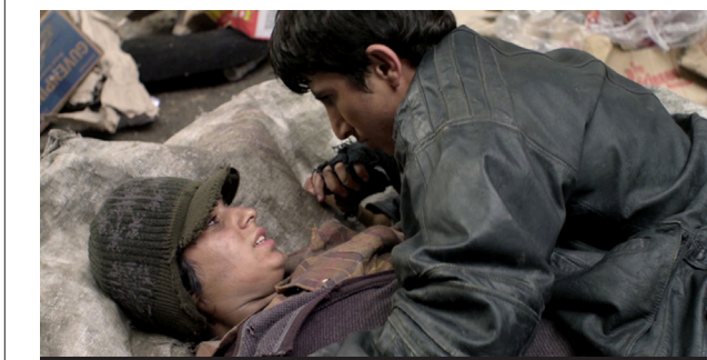
Förutom äran innebär utmärkelsen till "Før snøen faller" en prissumma på en miljon kronor.