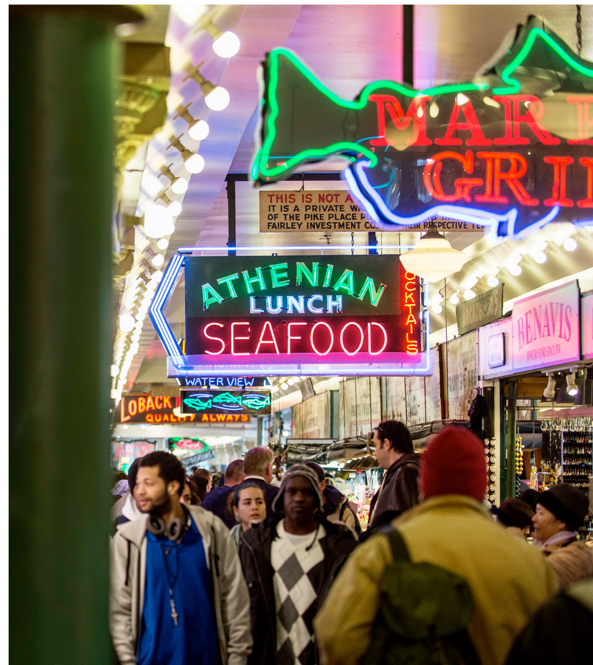
Vid Pike Place Market ligger lägenheten som huvudkaraktären Ana och hennes kompis Kate bor i.

– Det är lite irriterande, inte minst för att Seattle har så mycket mer att erbjuda. Det känns som om