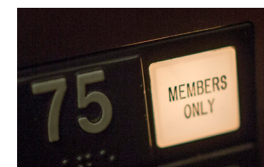
Klubben i Columbia Tower ligger i verkligheten på 75:e våningen.

ens stad har blivit exploaterad av någon som inte förstår sig på den, särskilt med tanke på att författaren aldrig ens hade varit här när hon skrev boken.