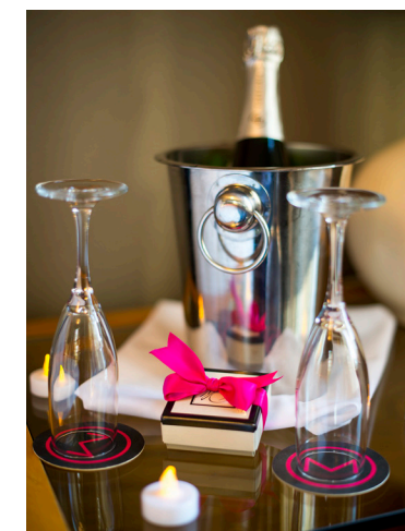
Hotel Max marknadsför sig som "Seattles sexigaste hotell".